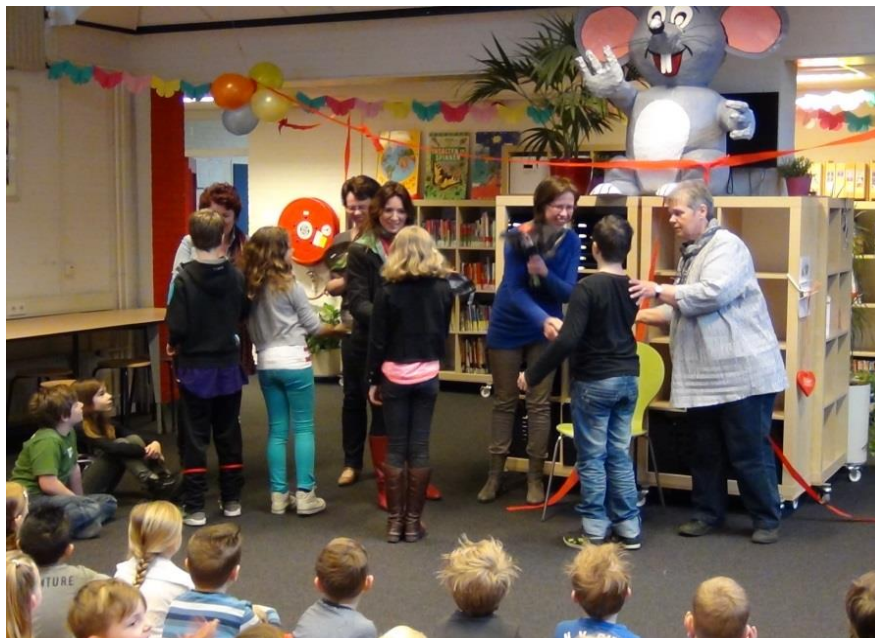
De leerlingen bedanken de bibliotheekouders voor hun extra werk